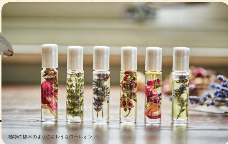
植物の標本のようにキレイなロールオン

※ラベンダーのキャリアオイルに、バラの蕾や花卉のドライフラワーを入れ、好きな精油をプラスしたロールオン。オリジナルの香りを楽しむことができます。