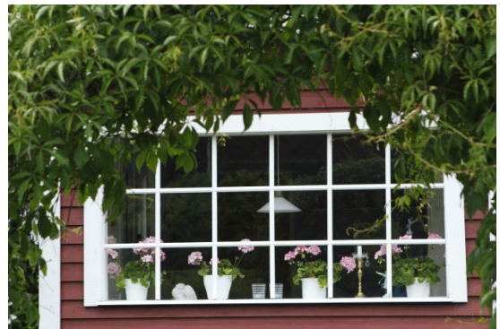
スウェーデンの窓辺の風景