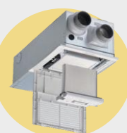
▲換気システム本体

家中の空気をきれいな状態に保つ秘訣は換気！スウェーデンハウスの換気システムは各部屋に新鮮な空気を供給しつつ、換気ユニット本体で集中して室内の空気を排気することで、家全体の空気が2時間に1回入れ替わるように設計されています。常に新鮮空気が室内に広がります。花粉はもちろん、PM2.5も95%カットできる微小粒子用フィルターも搭載♪きれいな空気環境を作ります。