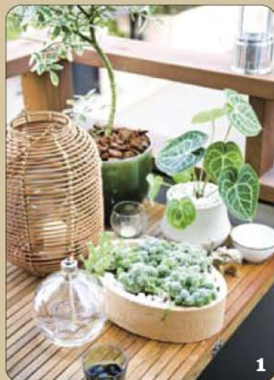
1 バルコニーに好きなテイストのグリーンを置いて。キャンドルは、口が広い器であれば好みの形のグラスなどを使用しても楽しい。小さな多肉植物のよせ植えは、鉢や土を変えるだけで上品な印象になる。

内の空気をきれいに保つためにも、定期的にお手入れしたい場所。初夏と年末にメンテナンスをしているというご主人は、「覚えてしまえば意外と簡単。やり終わると、またこれで空気がおいしくなったなって気分も良くなります」と、手際よく作業を終えました。