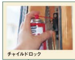
チャイルドロック