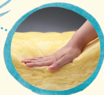
[ スウェーデンハウスの場合 ]

床 200mm、壁 120mm、天井 300mm の分厚く密度の高いグラスウールが、断熱性能を発揮しているよ。