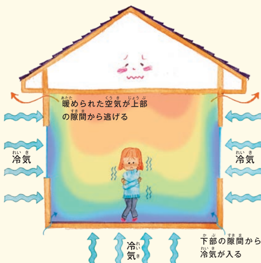
[ 一般住宅の場合 ]

スウェーデンハウスは、家の各部屋の温度差はごくわずか。1階と2階、床と天井など、上下の温度差も少なく、床暖房がなくても寒くないよ。